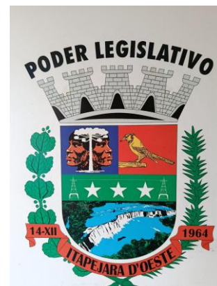
Brasão da Câmara Municipal